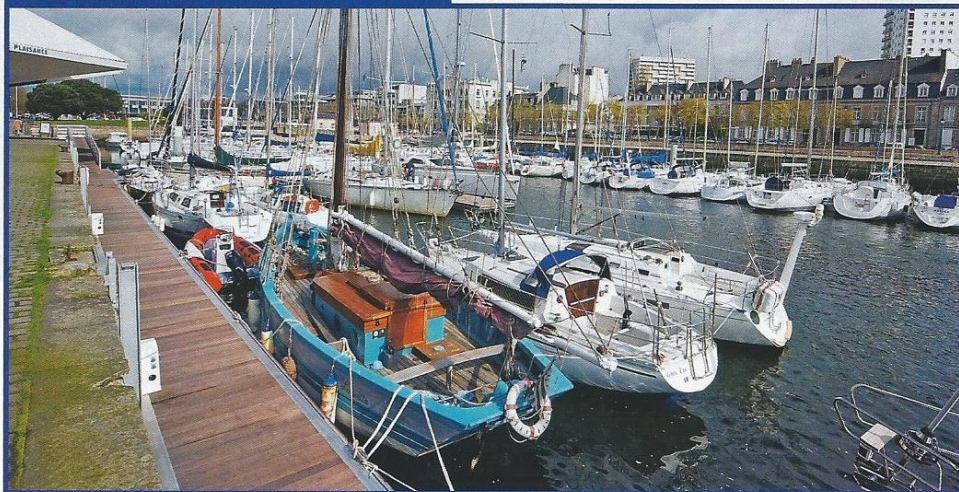
Lorient centre: excellente base d'accueil et point de départ d'une navigation dans la rade.