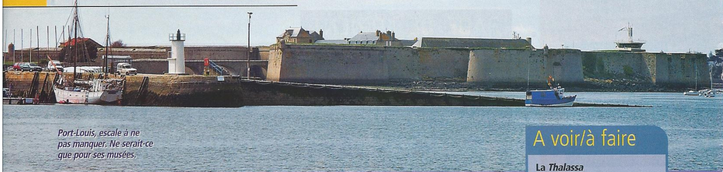
Port-Louis, escale à ne pas manquer. Ne serait-ce que pour ses musées.